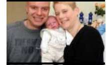
Hurra, ich bin da! Das sind Berlins süße Babys